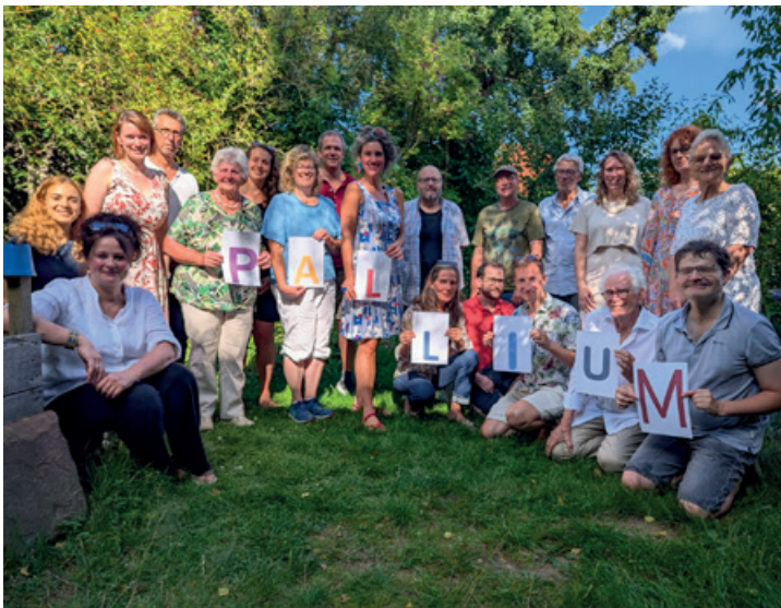
Pallium-Treffen im August 2025

Dazu gehörten im Finanzjahr 2025 die Firma Vistan Brillen GmbH (Schwäbisch Gmünd), der Verein Childrens Aid Namibia (Pforzheim), der Gemeinnützige Verein der Freunde und Förderer des Rotary Clubs Gotha (Gotha), die Stiftung der Familie Aulenbacher (Mainz), die Stiftung junge Menschen in Not (Gießen), und das Unternehmen Planalyze GmbH (Hünstetten).