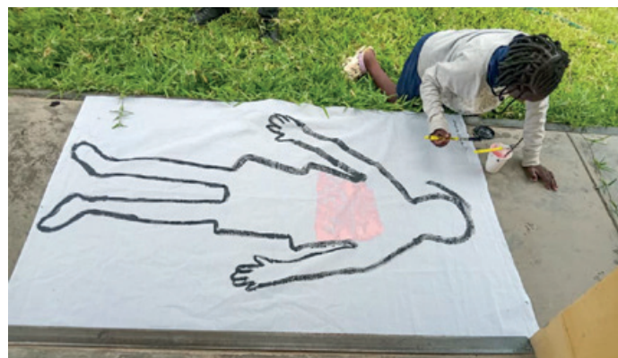
Bei Workshops kamen »Boddy-Mapping-Methoden« zum Einsatz, die helfen sollen, den eigenen Körper bewusster zu erleben. Für Kinder und Jugendliche, die von HIV/AIDS betroffen sind, ist das eine kreative Möglichkeit, um besser mit dem Status bzw. der Erkrankung umzugehen, um eigene Gefühle sichtbar zu machen und mit anderen zu teilen.

In der abgelegenen Kavango-Region im äußersten Norden Namibias engagiert sich die noch junge Maria Breeuwsma Charity Foundation (MBCF) für Kinder und Jugendliche, die mit HIV/AIDS leben. Geprägt wird die Region von der eindrucksvollen Flusslandschaft des Okavango, der hier die Grenze zum Nachbarland Angola bildet. Gleichzeitig zählt Kavango zu den strukturell benachteiligten Gebieten des Landes: Die Anbindung an das nationale Straßennetz ist lückenhaft, staatliche Dienstleistungen und zivilgesellschaftliche Angebote