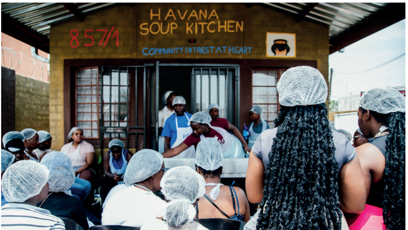
Oktober 2025: Frauen beim Backlehrgang in der Havana Suppenküche

Weitere Organisationen und Personen, die in 2025 Unterstützung erhielten, werden am Ende des Newsletters aufgeführt.