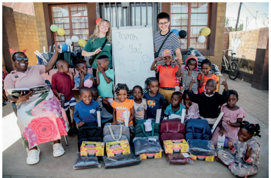
Große Freude: Die Abgänger der Suppenküche erhalten Winterjacken, Zahnpflege-Sets und Schulstarter-Pakete. Die weitere Umsetzung der Fördermaßnahme folgt in 2026.