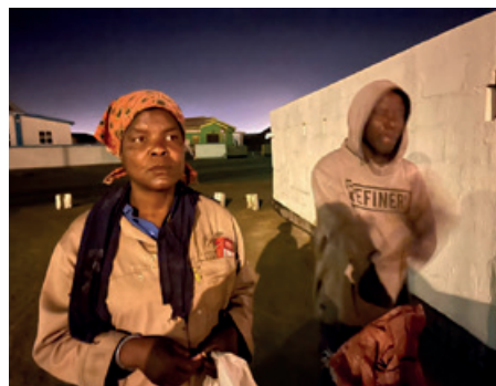
Auf der Suche nach Essbarem: »Digger« unterwegs in Swakopmund

künftig noch mehr Menschen in Not erreichen, mehr Ressourcen in Nahrungsmittelhilfen investieren. Aus diesem Grund planen wir den Aufbau einer mobilen Suppenküche für Digger und andere Menschen in Not. Dank unserer Spenderinnen und Spender ist es uns möglich, diesen Schritt zu gehen. In Kooperation mit lokalen Partnern in Swakopmund (dem Supermarkt Fruit & Veg und dem Unternehmen Cars and Guides for hire) starten wir das neue Projekt ab Januar mit einer Pilotphase. Im Unterschied zu stationären Ausgabestellen soll die Suppenküche flexibel entlang der Straßen fahren – dort, wo in den frühen Morgenstunden Müllabfuhr und viele Digger unterwegs sind und nach Verwertbarem suchen.