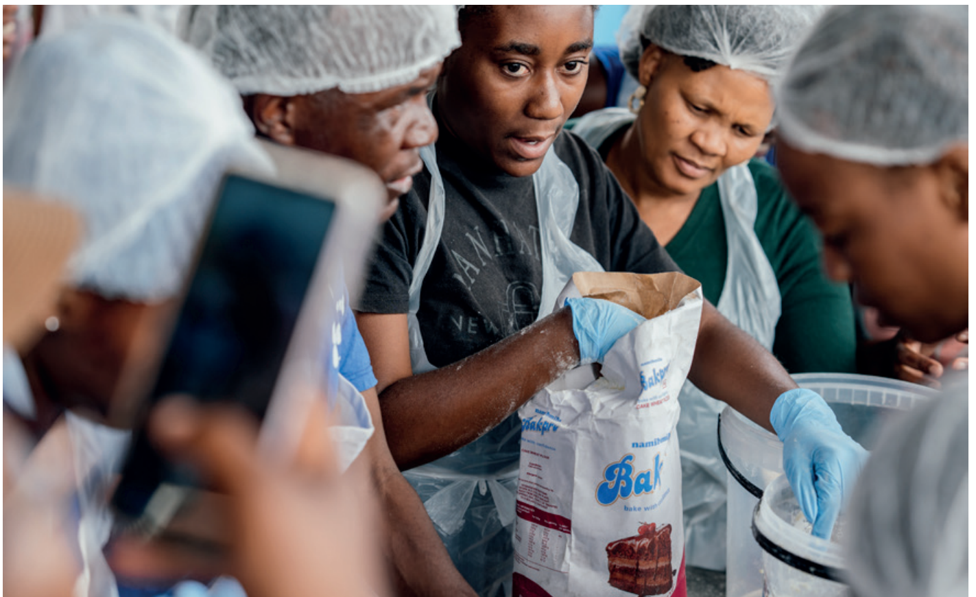
Oktober 2025: Pallium-Backworkshop in der Havana Suppenküche